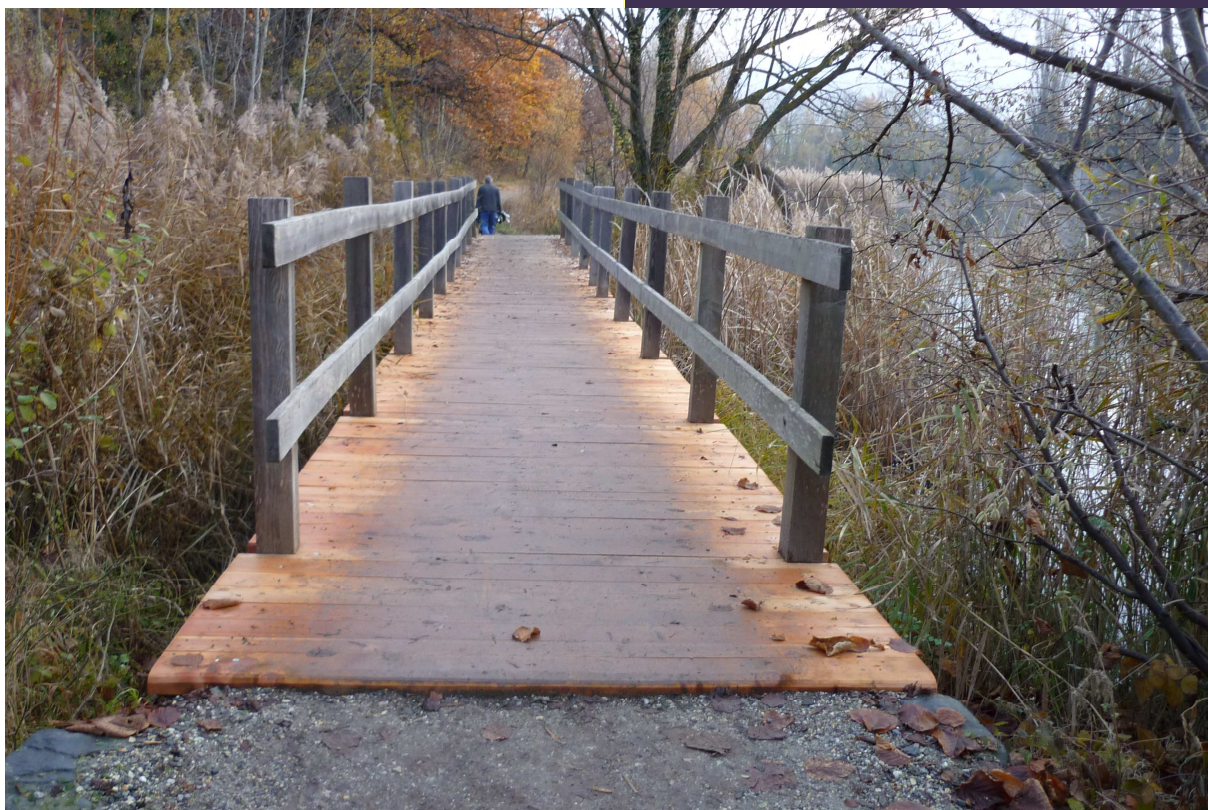
Photo de la passerelle rénovée Henri Mabillard

Divers travaux de maintenance des infrastructures ont été faits, notamment le pont en bois en rive nord du lac.