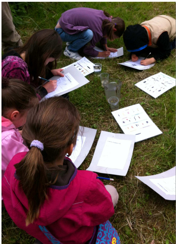
Mercredi nature du 15 mai 2013

Et pourtant... Derrière ces impressions et faits se cachent des oiseaux d'une grande intelligence, souvent polyvalents, capables de tirer parti de nombreuses situations nouvelles induites par notre civilisation.