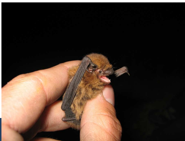
La pipistrelle