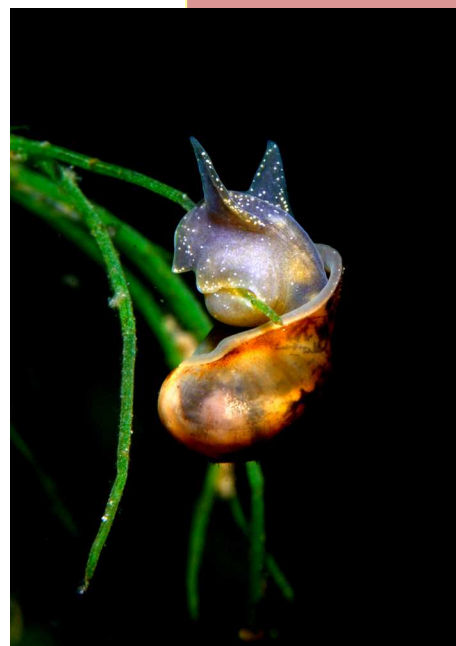
Michel Lonfat Limnée : escargot d'eau douce (taille env. 4cm) - gouille Valais central

Abeilles, termites et certains oiseaux vivant en colonies seront les sujets de cette nouvelle exposition.