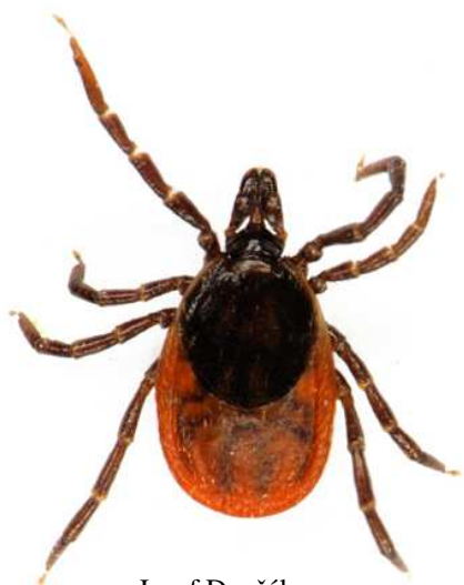
Ixodes ricinus