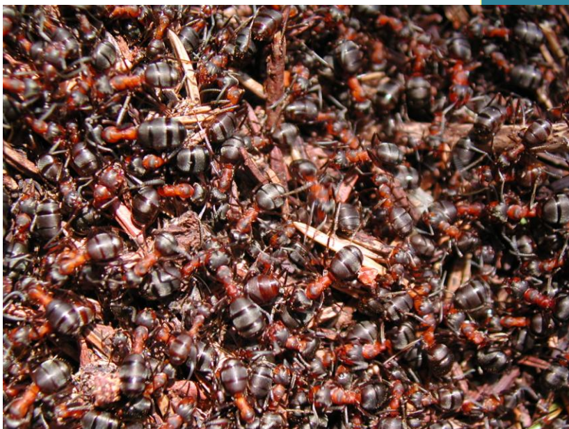
Photo : fourmis des bois à la surface d'une fourmilière. Arnaud Maeder