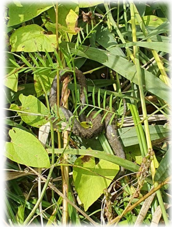
Couleuvre à collier

Le bureau Drosera va installer un tunnel à traces devant l'entrée des mustélidés pour connaître la fréquentation.