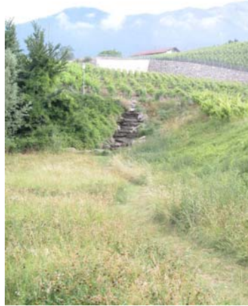
2. Un des déversoirs après la chambre de décantation