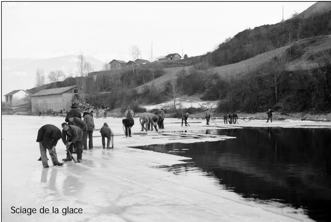
Sciage de la glace