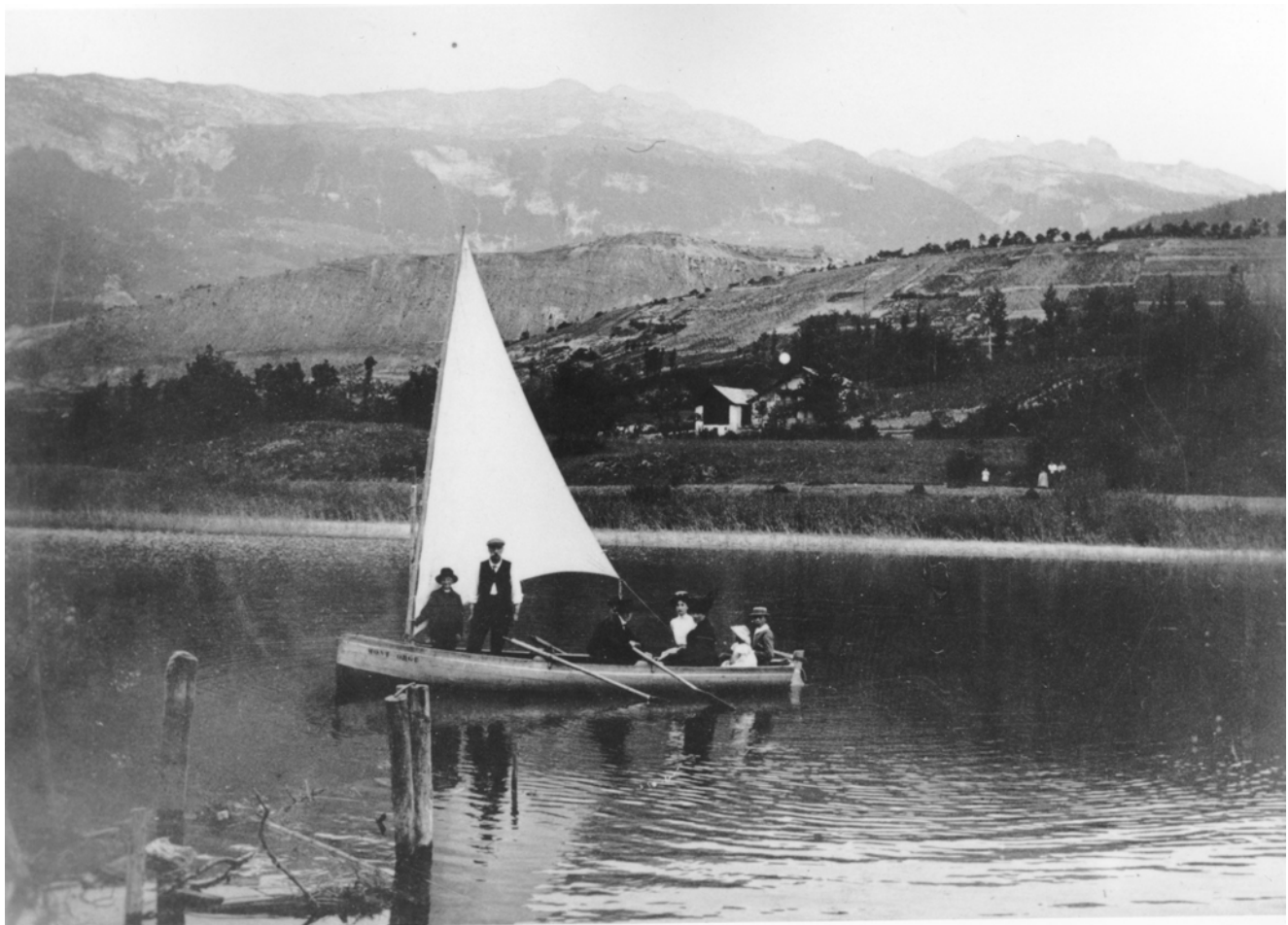
Une prise de vue datant probablement de 1910. Sur le flanc du bateau à voile figure l'inscription "Montorge".