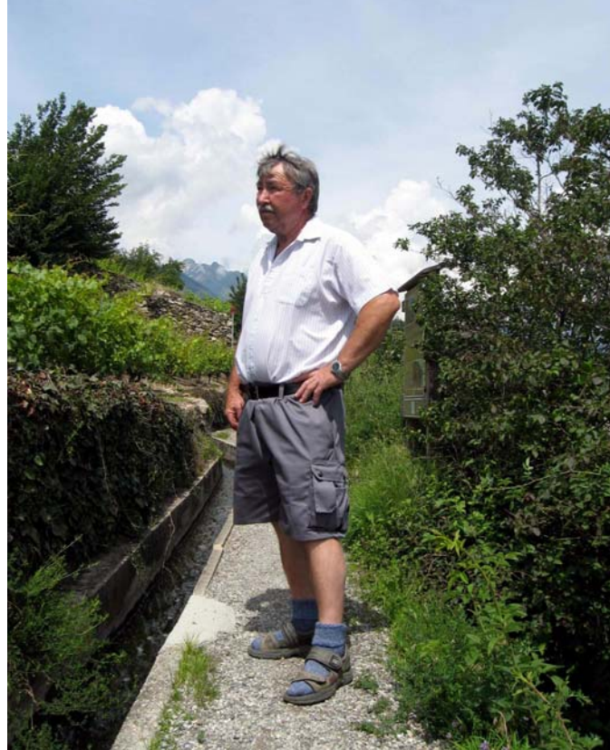
Gardien des bisses de Lentine et Montorge